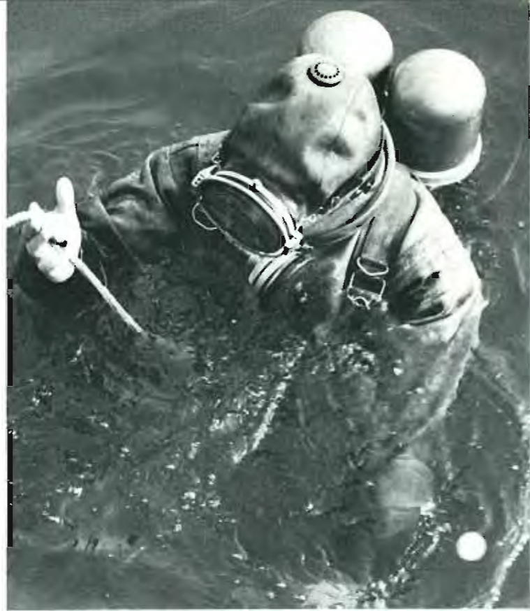
Abb. 1 Preßluftatmer PA 38/2800

anerkannte Geräte für das Tauchen bei den Feuerwehren